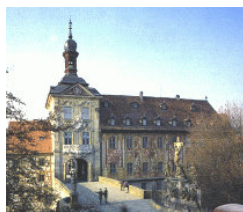
Altes Rathaus, Bamberg

Ganztagesausflug nach Bamberg. Vorl. Programm: Abfahrt 8.30 Uhr, Stadtbesichtigung von Bamberg mit anschließend rustikalem Vesper in einem Brauereikeller. Abschluss im Landgasthof „zum Kreuz“ in Zipplingen. Anmeldungen beim Vorstand bis spätestens 22.06.2003.