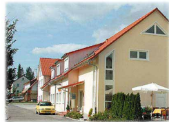
„Weißes Rössle“ Brastelburg

Abendwanderung ins Gasthaus „ Zum Weissen Rössle “ nach Brastelburg. Abmarsch für Wanderer 15.00 Uhr, Abfahrt für Autofahrer 16.45 Uhr, jeweils „Charlottenburg“.