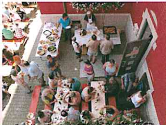
Sommerfest in der Braunenstraße