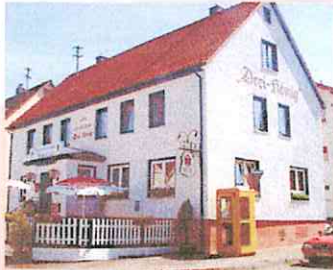
Pizzeria „Klaue“ Aalen, Hirschbach