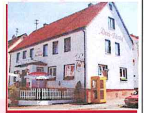
Pizzeria „Klause“ Inh.: Michele Frisi

04.01.2017 01.02.2017, 01.03.2017, 05.04.2017, 03.05.2017, 07.06.2017, 05.07.2017, 03.08.2017 , Sommerpause! 06.09.2017 , Sommerpause! 04.10.2017, 08.11.2017, 06.12.2017, 03.01.2018