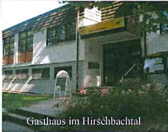
Gasthaus im Hirschbachtal