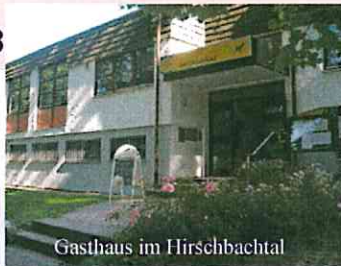
Gasthaus im Hirschbachtal

18. 00 Uhr, Jahreshauptversammlung. im Saal der „Gaststätte im Hirschbachtal“. Bekanntgabe des „sozialen Förderprojekts 2018“