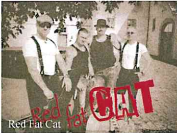
Red Fat Cat