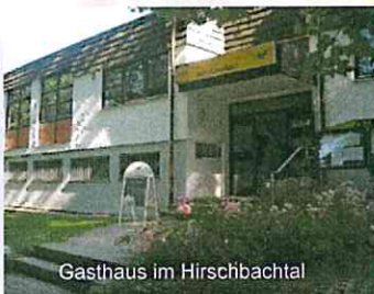
Gasthaus im Hirschbachtal