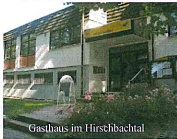
Gasthaus im Hirschbachtal