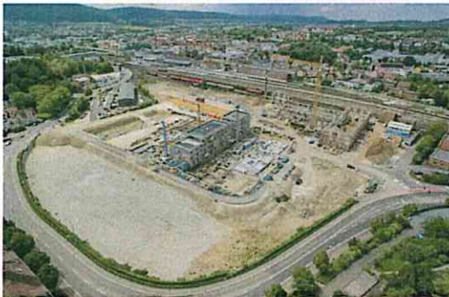
Großbaustelle Stadtoval, Aalen